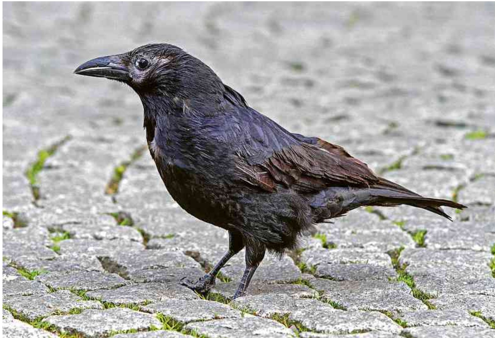
Eine Stadtkrähe. Bereits im Buch „Krähengekrächz“ (2016) beschäftigt sich Monika Maron mit diesen Vögeln. Am Bayerischen Platz trifft sie ein einbeiniges Exemplar.

Frances McDormand schuf in diesen zwei Minuten einen der eindrucklichsten Gänsehautmomente nicht nur dieser Oscar-Verleihung. Dazu gehört auch, dass sie den „inclusion rider“ nicht erklärte. Sie ließ ihr Publikum rätseln. Wer es dann herausbekommen hatte, wird es nicht so schnell wieder vergessen.